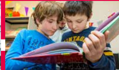
Bibliotheek op school