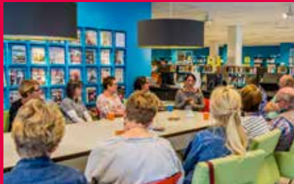
Werk zoeken met sociale media