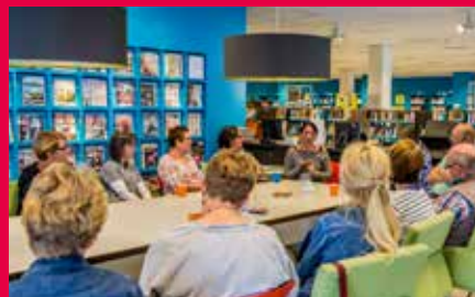
Werk zoeken met sociale media