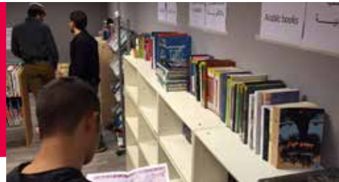
Pop-up Bibliotheek Heumensoord