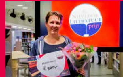
Winnaar Nijmeegse Literatuurprijs