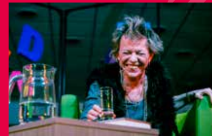
Literaire avond met Connie Palmen en Joris Luyendijk